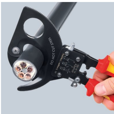
Skraldeprincip og togears-tandkransdrev for kraftsparende skæring