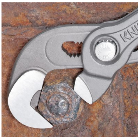
Arbejde på en rustne møtrik med rundede kanter